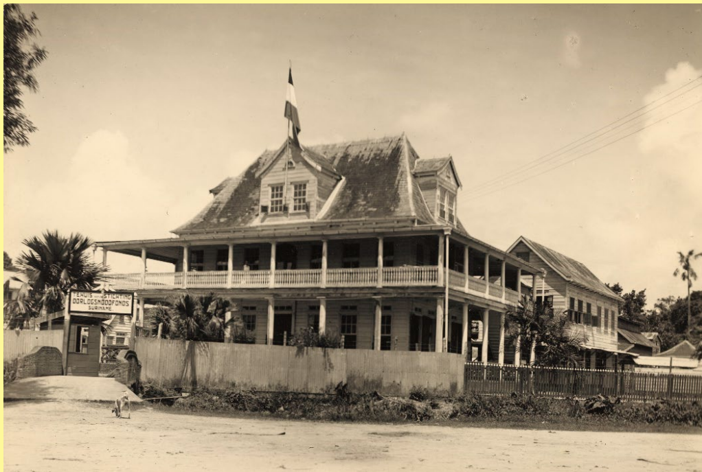
Tehuis voor Oorlogsvluchtelingen in Paramaribo, Suriname.

Tijdens de Tweede Wereldoorlog bereikten meer dan vijfhonderd, voornamelijk Joodse, vluchtelingen vanuit de Lage Landen het Caraïbisch gebied. Na een vaak gevaarlijke tocht grotendeels door bezet Europa, kwamen de vluchtelingen aan in Spaanse en Portugese havens vanwaar zij vertrokken naar Jamaica, Curaçao en Suriname. Bij aankomst in de Caraïben werden de vluchtelingen geïnterneerd, tot hun verbazing ook de Nederlanders op Nederlands grondgebied. De omstandigheden van deze kampen wisselden per plek: in Suriname en Curaçao waren bestaande gebouwen heringericht voor de vluchtelingen terwijl de vluchtelingen in Jamaica in nieuwe barakken verbleven. Op alle plekken van aankomst hadden de vluchtelingen weinig privacy, waren er restricties op bewegingsvrijheid en toegang tot eigen financiële middelen.